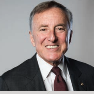
F. Bülent Eczacıbaşı

Eczacıbaşı Holding Yönetim Kurulu Başkanı Bülent Eczacıbaşı, çalışma yaşamına 1974 yılında başladı. 1991-1993 yıllarında Türk Sanayici ve İş İnsanları Derneği (TÜSİAD) Yönetim Kurulu Başkanlığı, 1997-2001 yıllarında TÜSİAD Yüksek İstişare Konseyi Başkanlığı, 1993-1997 yıllarında Türkiye Ekonomik ve Sosyal Etüdler Vakfı (TESEV) Kurucu Yönetim Kurulu Başkanlığı, 2000-2008 yıllarında ise İlaç Endüstrisi İşverenler Sendikası (İEİS) Yönetim Kurulu Başkanlığı yaptı. Bülent Eczacıbaşı, Eczacıbaşı Topluluğu şirketlerinde Yönetim Kurulu Başkanlığı görevlerini yürütmektedir.